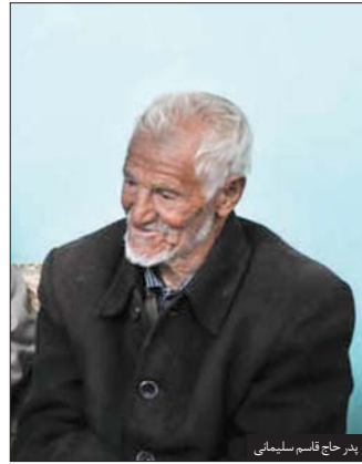
پدر حاج قاسم سلیمانی

این‌جا منزل قاسم سلیمانی است. ولی این‌جا نه پایگاه مخفی سپاه قدس است و نه حاج قاسم در این مکان زندگی می‌کند. این‌جا منزل مرحوم کربلایی قاسم سلیمانی اهویی، پیرمرد ۷۲ ساله‌ای است که اسفند ماه سال گذشته به رحمت خدا رفته است. کربلایی قاسم تا زمانی که زنده بوده مؤذن روستای اهوی شهرستان آشتیان استان مرکزی بوده و هر ساله منزلش محل اسکان روحانیون مبلغی بود که به روستا می‌آمدند. گویا این‌بار هم دشمنانی که بدشان نمی‌آمد با شیطنتهای‌شان محل زندگی حاج قاسم را نا امن نشان دهند، گاف بزرگی را انجام داده‌اند.