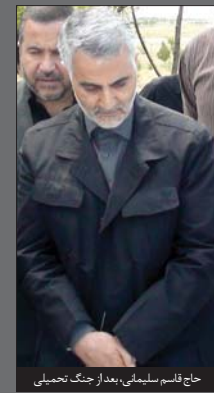
حاج قاسم سلیمانی، بعد از جنگ تحمیلی