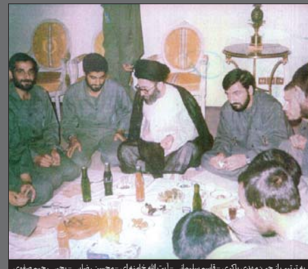
به ترتیب از چپ: مهدی باگری - قاسم سلیمانی - آیت‌الله خامنه‌ای - محسن رضایی - یحیی رحیم صفوی